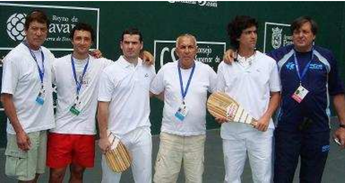
Delegación Argentina. IV Copa del Mundo