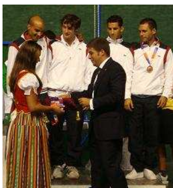
Selección Francesa Frontenis Masculino