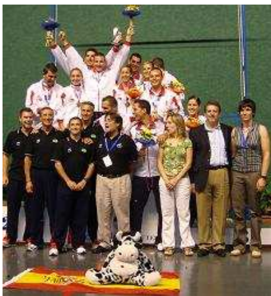
Selección Española. IV Copa del Mundo F30

La IV Copa del Mundo de frontón a 30 metros celebrada en Tenerife desde el 8 al 12 de septiembre ha supuesto el comienzo de un nuevo y esperanzador capítulo de esta disciplina.