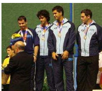
Argentina, PLATA en Paleta Goma