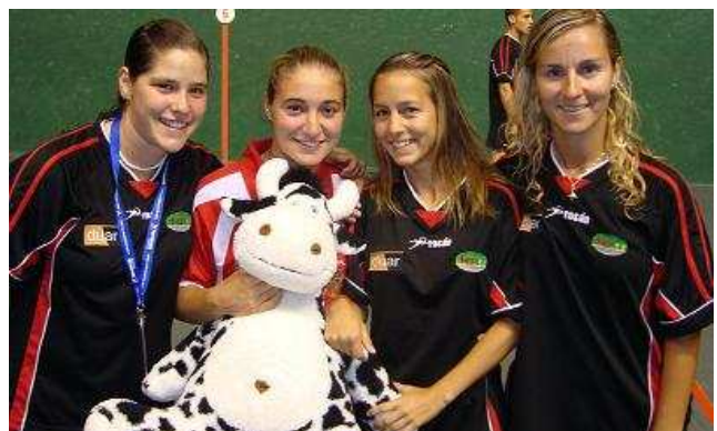
Equipo español Frontenis Femenino con la mascota IV Copa del Mundo

E.M: La medalla de oro yo creo que la colgare en mi cuarto, en un sitio visible para asimilar lo que este año se ha conseguido (risas).