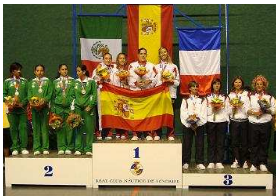
Podium Frontenis Femenino