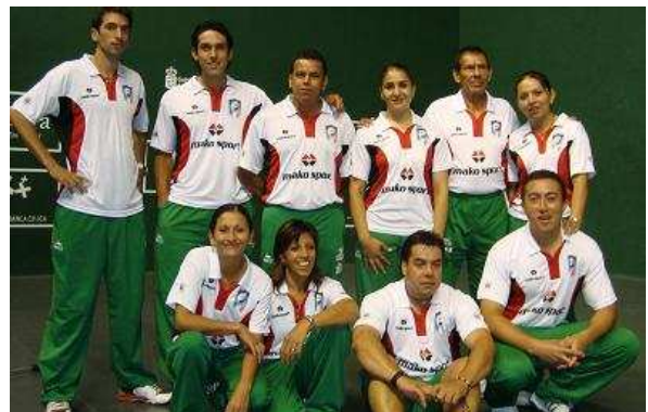
Selección Mexicana de Frontón a 30 metros