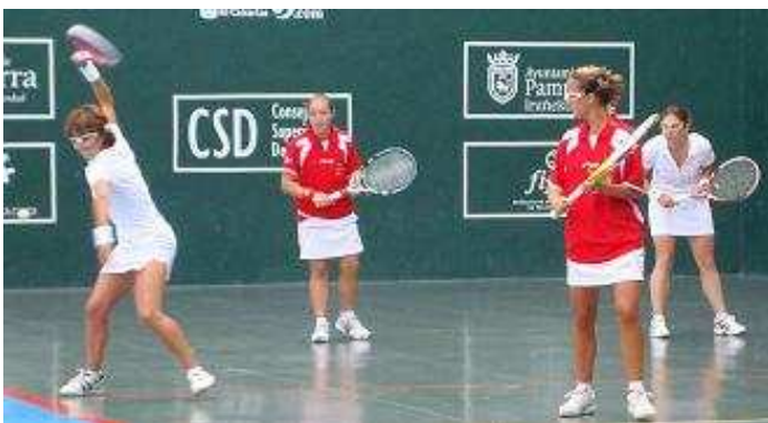
Delantera francesa realizando un saque