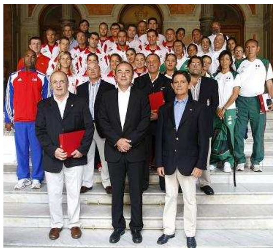
Foto de Grupo de todas las delegaciones