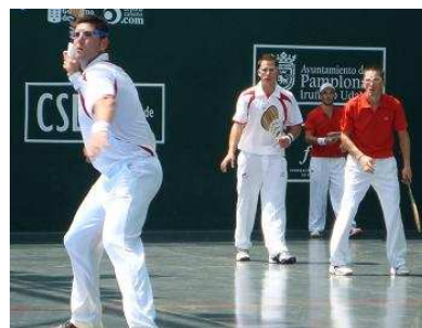
Partido de la fase previa: España vs. Francia