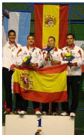
España, ORO en Paleta Goma