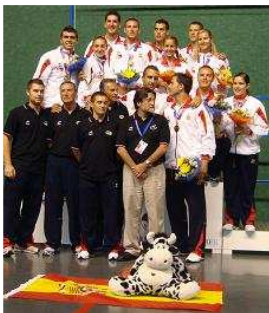
España Campeona de la IV Copa del Mundo de Frontón a 30 metros