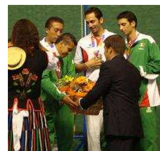
México, BRONCE en Paleta Goma