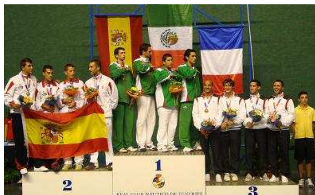
Podium Frontenis Masculino