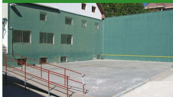
Estado actual del "frontón" de Jaca Lo que llaman Frontón