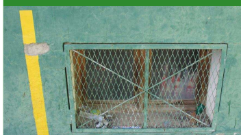
Estado actual del "frontón" de Jaca Taquilla para refrescos