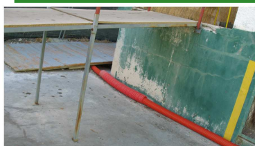
Estado actual del "frontón" de Jaca ¿Será fibra óptica?