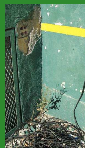
Estado actual del "frontón" de Jaca Práctica de poda