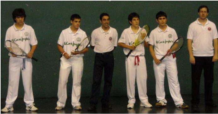
Campeonato de Vizcaya 2008/09. Finalistas categoría Juvenil

Pero si la meta es, además, poder llegar a competir al más alto nivel y llegar a donde ya están algunos, el análisis cambia radicalmente. Hay carencias y un largo camino por recorrer. Es desde esta perspectiva donde deben situarse las siguientes opiniones, así como los problemas que veo y que nos dificultan disminuir la distancia actual con los que están arriba.